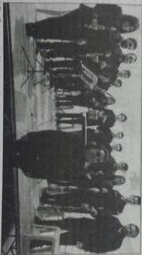
Il Clarifagot ensemble

Il compositore Dario Fagnano IV Ambrosio ha scritto per questa formazione la composizione "Gratie di luce" eseguita in prima assoluta in occasione del 50° anniversario di istituzione.